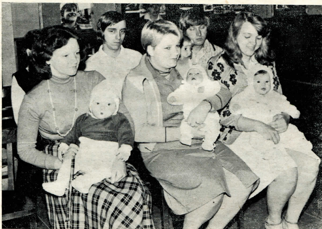
Z posledního vítání občánků

s láskou je vítáme... Z lásky přišly na svět,